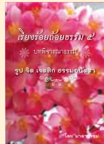
เล่มที่ ๕ เรื่องร้อยถ้อยธรรม (รูป จิต เจตสิก ธรรมอนัตตา)