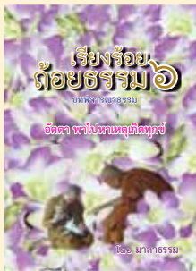
เล่มที่ ๖ เรื่องร้อยถ้อยธรรม (อวดตา พาไปหาเหตุเกิดทุกข์)