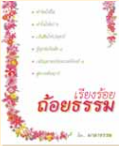
เล่มที่ ๑ เรื่องร้อยถ้อยธรรม (บทพิจารณาธรรม)