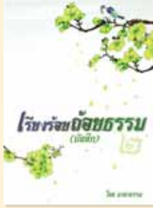
เล่มที่ ๒ เรื่องร้อยถ้อยธรรม (บันทึก) (บทพิจารณาธรรม)