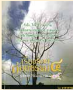
เล่มที่ ๔ เรื่องร้อยถ้อยธรรม (บทพิจารณาธรรม)