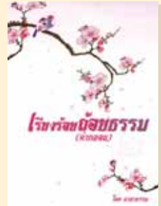
เล่มที่ ๒ เรื่องร้อยถ้อยธรรม (คำกลอน) (บทพิจารณาธรรม)