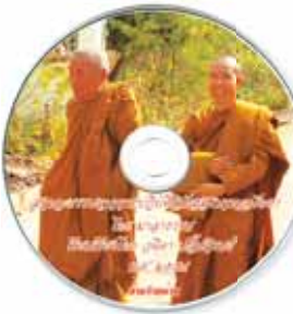
สภาวะธรรมจากการปฏิบัติ วิปัสสนากาวนาอนัตตา