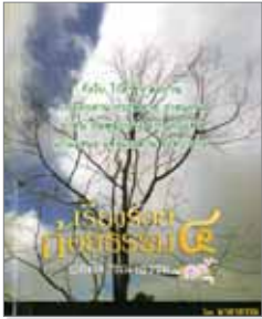
เล่มที่ 4 เรื่องร้อยถ้อยธรรม (บทพิจารณาธรรม)