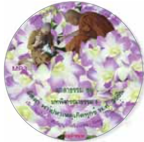
บทพิจารณาธรรม 6