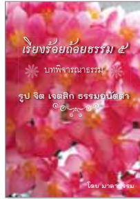
เล่มที่ 5 เรื่องร้อยถ้อยธรรม (รูป จิต เจตสิก ธรรมอนัตตา)