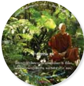
วิธีฝึกปฏิบัติวิปัสสนากาวนา 2 ชั่วโมง พร้อมข้อคิดข้อปฏิบัติธรรม พ.ศ. 2556 (3 ตอน)