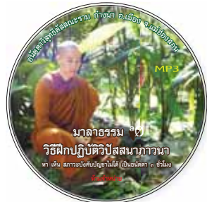
วิธีฝึกปฏิบัติวิปัสสนากาวนา 3 ชั่วโมง พร้อมข้อคิดข้อปฏิบัติธรรม พ.ศ. 2556 (3 ตอน)