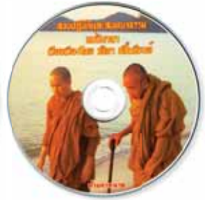
สอนปฏิบัติและสันทนาธรรม