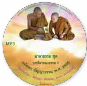
บทพิจารณาธรรม 7