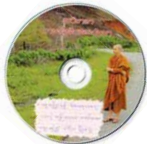
แม่วิมาลาภาษาไต้สิบสองปันนา