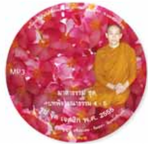
บทพิจารณาธรรม 4-5