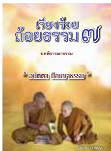
เล่มที่ 7 เรื่องร้อยถ้อยธรรม (อนัตตา ปัญญาธรรม)