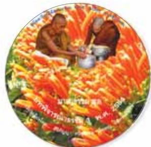
บทพิจารณาธรรม 3