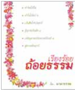
เล่มที่ 1 เรียงร้อยถ้อยธรรม (บทพิจารณาธรรม)