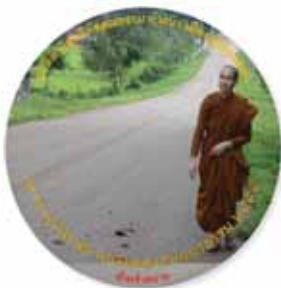
อบรมและสันทนาธรรม 2554