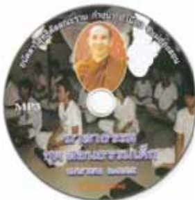
มาลาธรรม ชุดสอนธรรมเด็ก เมษายน 2555