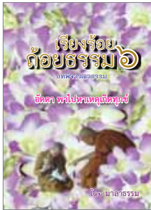
เล่มที่ 6 เรื่องร้อยถ้อยธรรม (อิตตา พาไปหาเหตุเกิดทุกข์)