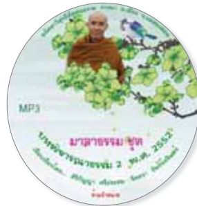
บทพิจารณาธรรม 2