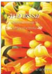
เล่มที่ 3 เรียงร้อยถ้อยธรรม (บทพิจารณาธรรม)