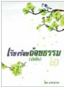
เล่มที่ 2 เรียงร้อยถ้อยธรรม (บันทึก) (บทพิจารณาธรรม)